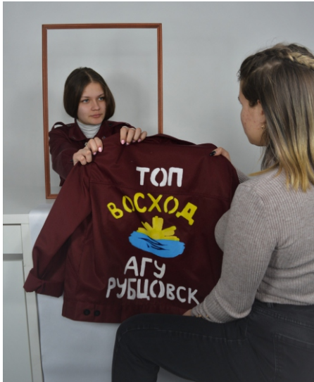
Рубцовский институт (филиал) АлтГУ.

Смотр песни и строя – 3 место ТОП «Восход» ,