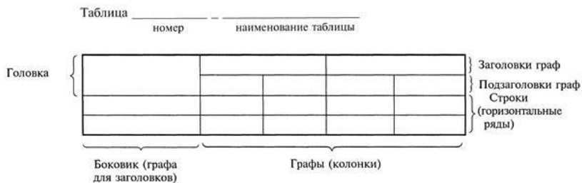
Рисунок 1 – Пример оформления таблицы

3.4.7 Если повторяющийся в разных строках графы таблицы текст состоит из одного слова, то его после первого написания допускается заменять кавычками; если из двух и более слов, то при первом повторении его заменяют словами «То же», а далее - кавычками. Ставить кавычки вместо повторяющихся цифр, марок, знаков, математических и химических символов не допускается. Если цифровые или иные данные в какой-либо строке таблицы не приводят, то в ней ставят прочерк.